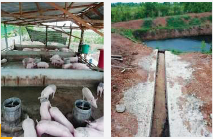
ຄອກໝູໃໝ່ຂອງ ນາງ ດ້າວ ທີ່ໄດ້ອອກແບບຈາກການຊ່ວຍຂອງທາງ ພະນັກງານກະສິກຳເມືອງ. ພື້ນຄ້ອຍລົງເຮັດໃຫ້ງ່າຍໃນການຮັກສາ ຄວາມສະອາດ ແລະໄຫລລົງໄປຕາມຮ່ອງນ້ຳຈົນຮອດໝູອງນ້ຳ ເພື່ອຈັດເກັບ ຮອດຍາມແລງເອົາໄປໃສ່ໃນນ້ຳເຂົ້າທີ່ຢູ່ໃກ້.

ຄວາມຕ້ອງການໝູແມ່ນກຳລັງເພີ່ມຂຶ້ນ ແລະ ດ້ວຍການສະໜັບສະໜູນ ຈາກທາງໂຄງການ CDAIS ຊາວກະສິກອນແມ່ນໄດ້ມີການປັບປຸງຮູບ ແບບການຜະລິດຢ່າງເຫັນໄດ້ຈະແຈ້ງເຊັ່ນ: ຍົກຕົວຢ່າງ ນາງ ດ້າວ ລົງທຶນ ຢູ່ປະມານ 25 ລ້ານກີບດ້ວຍເງິນລາວເອງເພື່ອສ້າງ ແລະ ປັບປຸງຄອກຫມູ ໃຫ້ທັນສະໄໝ. ໂຄງການໄດ້ສົ່ງເສີມກຸ່ມເພື່ອເຮັດວຽກຮ່ວມກັບພະນັກງານ ກະສິກຳເມືອງ, ແລະ ປຶກສາຫາລືທາງດ້ານວິຊາການຮ່ວມກັບທາງພະ ນັກງານສົ່ງເສີມຄື: ທ່ານ ສຸຖາວອນ ທີ່ໄດ້ເຮັດວຽກນຳກຸ່ມຊາວກະສິກອນ. “ການອອກແບບຄອກໃຫ້ແບບງ່າຍໆມີເຮືອນຮົມໃນການຮັກສາ ຄວາມສະອາດແລະດີສຳຫຼັບສຸຂະພາບສັດ,” ລາວໄດ້ອະທິບາຍອີກວ່າ: ພື້ນສີເມັນໃຫ້ຄ້ອຍໆລົງໜ້ອຍໜຶ່ງຈະເຮັດໃຫ້ງ່າຍໃນການອານາໄມ ຂີ້ໝູ ແລະ ນ້ຳຢຽວມັນຈະໄຫລລົງສູ່ຮ່ອງໄດ້ງ່າຍ ແລະໄປຫາຖັງເກັບ ທີ່ກຽມໄວ້. ຫມູຈະຖືກແຍກຂັງຕາມອາຍຸ ເພື່ອເຮັດໃຫ້ການໃຫ້ອາຫານມີ ປະສິດທິພາບ.