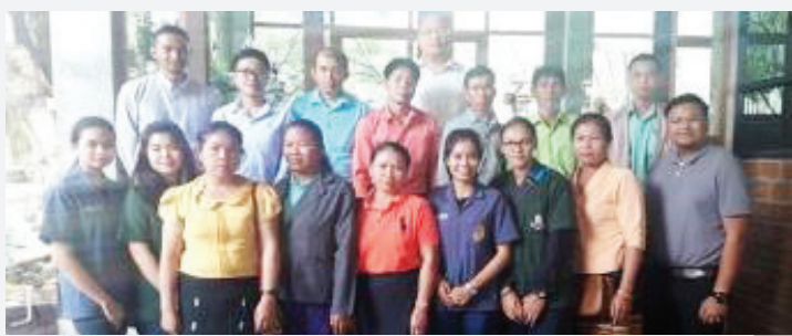
ສະມາຊິກຂອງກຸ່ມລ້ຽງໝູ ໃນຊ່ວງການຢ້ຽມຢາມທັດສະນະສຶກສາຂອງພວກເຂົາເຈົ້າທີ່ປະເທດໄທ.

“ຜົນໄດ້ຮັບທີ່ສໍາຄັນຂອງຂະບວນການປະຕິບັດໂຄງການ CDAIS ແມ່ນຄວາມໝັ້ນໃຈທີ່ໄດ້ຈາກການຮຽນຮູ້ປະສົບການອັນໃໝ່ໃນການພັດທະນາ ແລະ ແຜນການເຄື່ອນໄຫວການຈັດຕັ້ງປະຕິບັດຕົວຈິງ.”