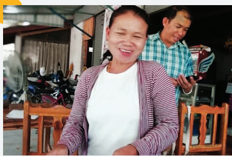
“ຂ້ອຍເກັບເງິນແຕ່ນາໆເພິ່ງເປັນຜູ້ຈ່າຍມັນ” ນາງປານີ ເວົ້າຢອກ.