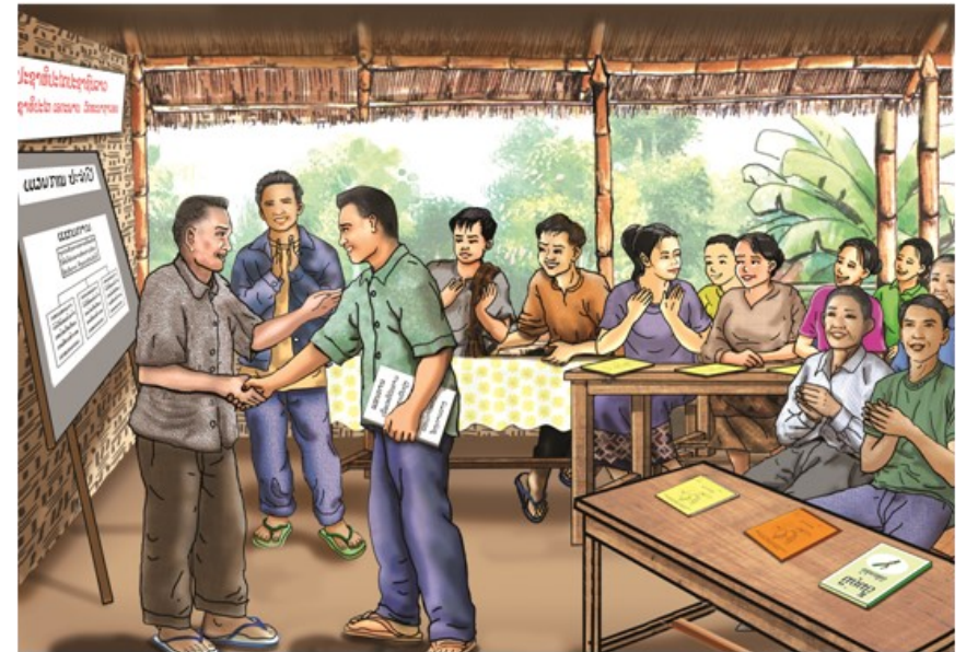
ການເຮັດສັນຍາຄ້ຳປະກັນລາຄາຜົນຜະລິດ

ຄະນະບໍລິຫານງານກຸ່ມ ມີສິດປົກປ້ອງສິດຜົນປະໂຫຍດ ຂອງກຸ່ມໂດຍຊອບທຳ ເພື່ອລຶກລ້ຽງການເອົາລັດເອົາປຽບ ຈາກບຸກຄົນພາຍນອກ ແລະ ພໍ່ຄ້າຄົນກາງ ໃນການເກັບຊື້ຜົນຜະລິດ, ການກົດລາຄາ, ການເອົາລັດເອົາປຽບໃນທຸກຮູບການທີ່ອາດຈະເກີດຂຶ້ນກັບສະມາຊິກກຸ່ມ. ເພື່ອຫຼີກລ່ຽງບັນຫາດັ່ງກ່າວ, ຄະນະບໍລິຫານງານກຸ່ມ ຕ້ອງເປັນເຈົ້າການໃນການຕໍ່ລອງເຈລະຈາກັບຜູ້ເກັບຊື້, ຜູ້ລົງທຶນ, ຜູ້ສະໜອງປັດໃຈຂາເຂົ້າການຜະລິດ ແລະ ພາກສ່ວນອື່ນໆ ເພື່ອຮັບປະກັນດ້ານລາຄາຜົນຜະລິດ ຫຼື ສ້າງຜົນປະໂຫຍດສູງສຸດແກ່ສະມາຊິກກຸ່ມ. ໃນນີ້ອາດເຮັດສັນຍາໂດຍກົງກັບຜູ້ເກັບຊື້ ແລະ ຜູ້ບໍລິການອື່ນໆ ດ້ວຍຫຼັກການຕ່າງຝ່າຍກໍ່ມີຜົນປະໂຫຍດ ແລະ ຍອມຮັບທຸກເງື່ອນໄຂໃນສັນຍາ.